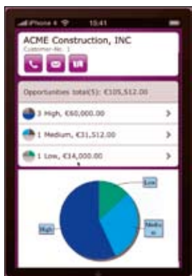
In der mobilen Außendienstanbindung von Abas-ERP stehen grafische Auswertungen zur Verfügung.

spielsweise ermöglicht die Außendienstanbindung der Abas-Business-Software mit ihrem neuen Bedienkonzept, kundenbezogene Daten wie beispielsweise Verkaufsvorgänge mit Laptop, Tablet-PC oder Smartphones überall auf der Welt und zu jeder Zeit anzuzeigen und zu bearbeiten. Die Bedienung der Abas-ERP Mobile Solutions ist nicht an gerätespezifische Gegebenheiten gebunden. Alle mobilen Abas-ERP-Applikationen lassen sich in gängigen Browsern, auf Tablets,